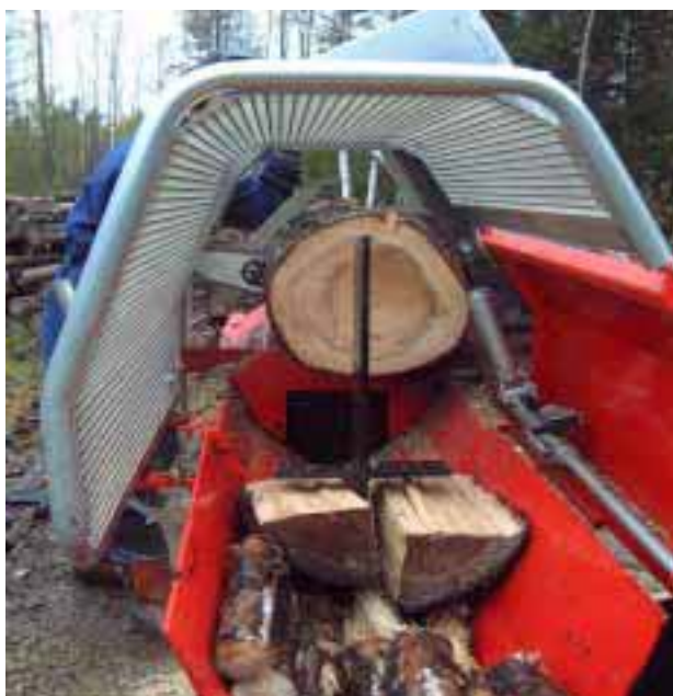
Bild 23: Kapning och klyvning. Notera hur vedlängdsbegränsaren viker undan.