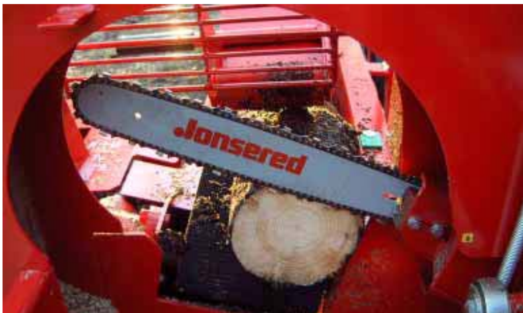
Bild 21: Kapsvärdet.