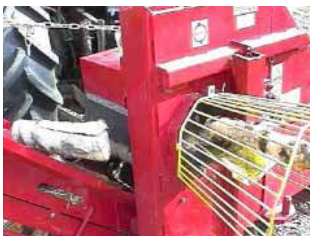
Bild 36B: Weimer i drift.