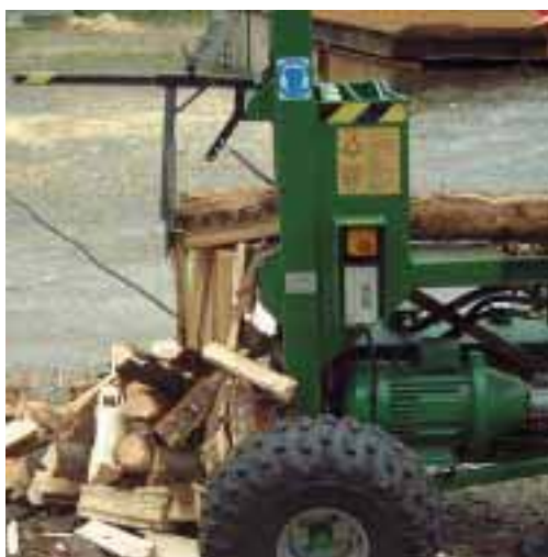
Bild 37. Inmatning av ved.

Långveden läggs upp på ett inmatningsbord och matas manuellt fram mot en vedlängdsbegränsare. Den kombinerade kap och klyvrörelsen utförs med en klipp och klyvkniv monterad på en vertikal hydraulcylinder som manövreras av ett reglage som direkt påverkar hydraulventilen. Se bild 1 och 37. Sedan körs kniven upp manuellt. Drivningen sköts av en elmotor och en hydraulpump.