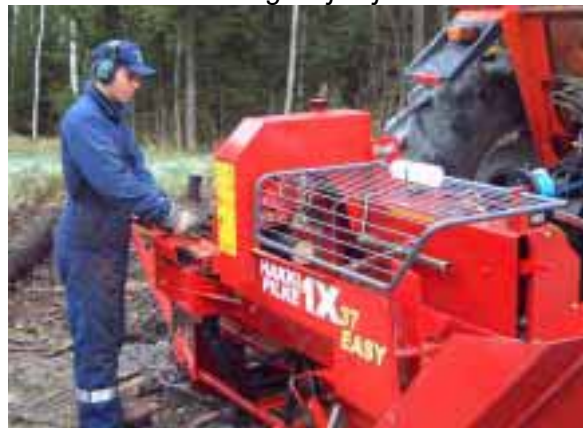
Bild 20: Körning av maskinen.