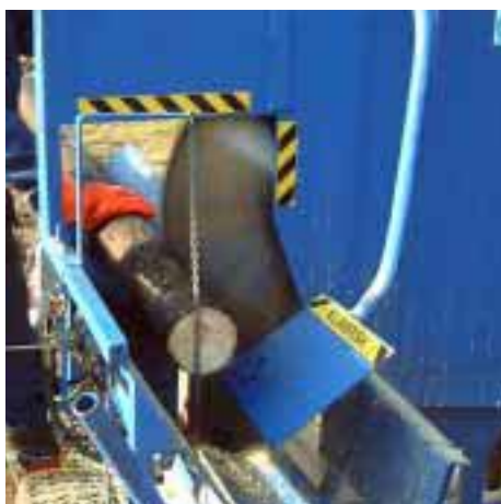
Bild 6: Vedlängdsbegränsare.

Hjul och dragstång med kulhandske gör det möjligt att förflytta den med personbil.