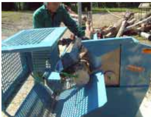
Bild 2: Vedlängdsbegränsare.

Långveden läggs upp på ett inmatningsbord typ vagg och matas manuellt fram i önskad längd mot en vedlängdsbegränsare. Se bild 2. Kapning sker med fast kapklinga och rörligt matarbord typ vagg. Veden faller sedan ned i en ränna, och klyvs mot en med fotpedal justerbar korskniv med en manuellt påverkbar hydraulcylinder. Den cylindern går sedan automatiskt tillbaka till utgångsläget. Maskinen har en trefas elmotor som driver både kapklingan och en hydraulpump som matar klyvcylindern. Lösningen framgår av bild 3. Maskinen är försedd med luftgummihjul.