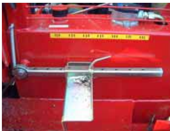
Bild 19: Vedlängdsbegränsaren.