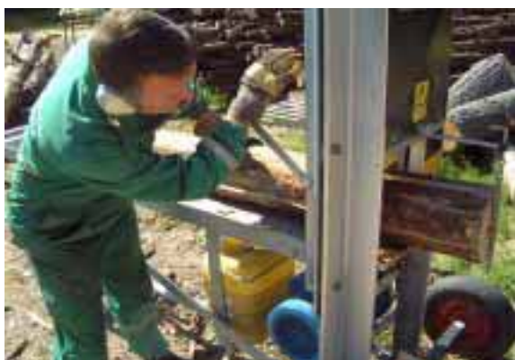
Bild 41: Svårt att se vedlängdsbegränsaren.