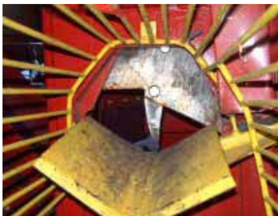
Bild 33: Inmatning och klipp/klyvkniv.

Denna maskin är av traktordrivnet utförande. Den kopplas till traktorns trepunktsfäste och drivs av kraftuttaget. Långveden matas in i maskinen mot en justerbar vedlängdsbegränsare. Se bild 34. Därefter kapas och klyvs veden i en och samma rörelse av en kombinerad klipp och klyvkniv. Under arbetet vilar långveden på en avfjädrad stockhållare. Denna har till uppgift att avlasta operatören och minska slag då veden kapas. Delar av denna konstruktion visas på bild 33. Den kapade och kluvna veden faller ned på en bandtransportör som matar ut den färdiga veden ur maskinen. Kniven beskriver en upp och nedgående rörelse och är ständigt igång vilket innebär att det inte finns några reglage, utan operatören matar bara in långveden i den takt kniven klipper den. Arbetsprincipen framgår av skissen på bild 35. Önskar man klyva i fyra delar roterar man den inmatade långveden 90 grader för varje klipp, vilket gör att långveden förklyvs. Man kan även mata in flera långved åt gången om de har liten diameter.