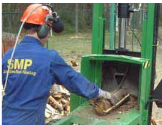
Bild 1: Mätning av bullernivå.