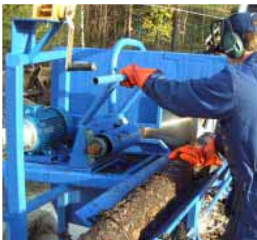
Bild 9: Under körning. Kapbordet.