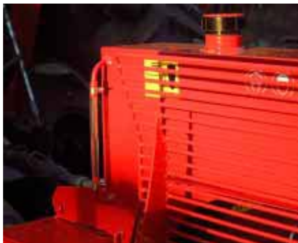
Bild 18: Nivårör för sågkedjeolja.