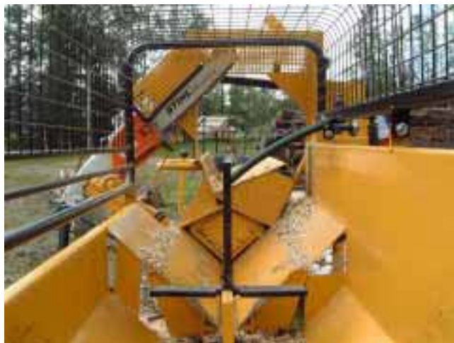
Bild 25: Den elektriska motorsågen på sin vagga.