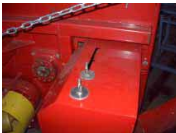
Bild 34: Justering av vedlängdsbegränsare.