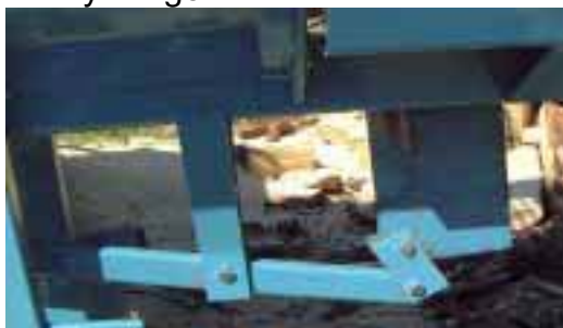
Bild 4: Justering av klyvknivens höjd.