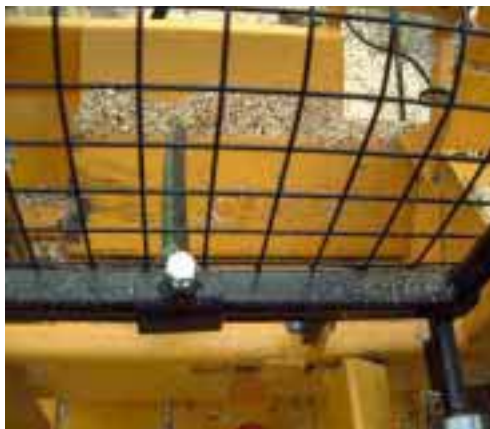
Bild 24: Vedlängdsbegränsare

Långveden läggs upp på 2 st inmatningsrullar bestående av gummihjul och ett inmatningsbord. Långveden matas sedan manuellt in till önskad kaplängd. En enkel vedlängdsbegränsare bestående av en gummislang på en skjutbar skena styr vedlängden. Se bild 24. Veden kapas sedan med en elektrisk motorkedjesåg som är monterad på en kullagrad vagga. Se bild 25 och 27. Den kapade veden faller sedan ned i en ränna och klyvs med en manuellt manövrerad hydraulcylinder mot en korskniv. Klyvkniven är mekaniskt höj och sänkbar via ett handreglage. Klyvcylindern går sedan automatiskt tillbaka till utgångsläget. En elmotor driver en hydraulpump som matar klyvcylindern.