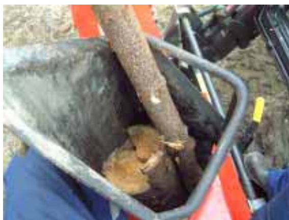
Bild 49: Inmatningen på Igland.