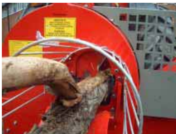
Bild 29: Klippning och klyvning i samma rörelse med Klappi.