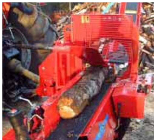
Bild 16: Inmatningsbandet.