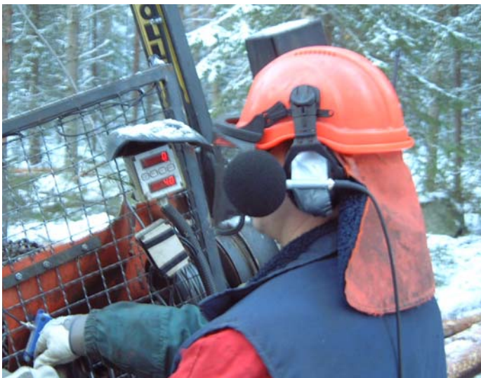
Bild 1: Mätning av buller på operatörsplatsen. Samtliga maskinförare använde hörselskydd.

Bullermätning utfördes enligt följande. En mikrofon placerades på en hjälm vid operatörens öra. Sedan uppmättes den genomsnittliga bullernivån (ekvivalent ljudnivå L_{eq} ) under 2-5 minuters perioder. Mätningen utfördes med olika träslag och olika diametrar. Observera att bullervärdena inte är helt jämförbara, utan skall ses som ett medelvärde för den aktuella arbetsprincipen på maskinen. En förklaring till detta är att maskinerna har olika typ av drivning, olika traktorer och det är omöjligt att mäta alla maskinerna under samma förutsättningar.