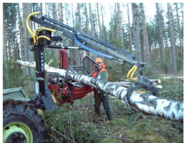
Bild 11: Hypro 450 XL i position för vinschning Bild 12: Iläggning av träd med kranen.