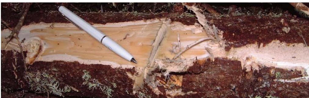
Bild 7. Skador på virket efter upparbetning med NIAB processor.

Även om stegmatore anses orsaka mindre skador på virket än valsmatade processorer så kan i ogynnsamma fall virket få skador av glidning i gripklor och även hack som uppstår då klorna nyper åt runt stocken. Exempel på detta illustreras i bild 7. Detta problem blir mindre på vintern då virket är fruset, och kvistarna är sprödare.