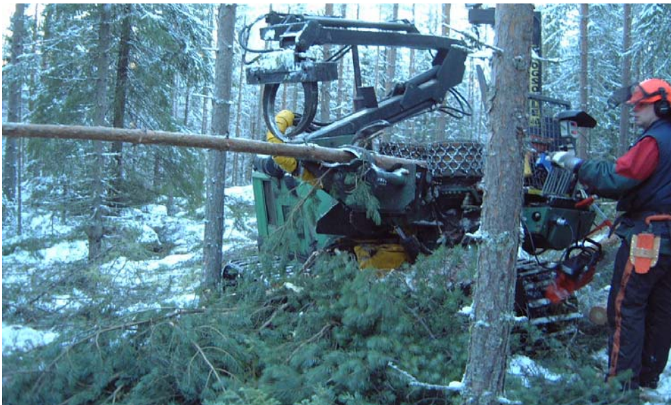
Bild 20: Efter några träd på samma ställe samlas ris och kvistar vid maskinen.